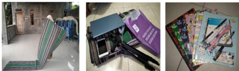
Gambar 2. Tahap Persiapan