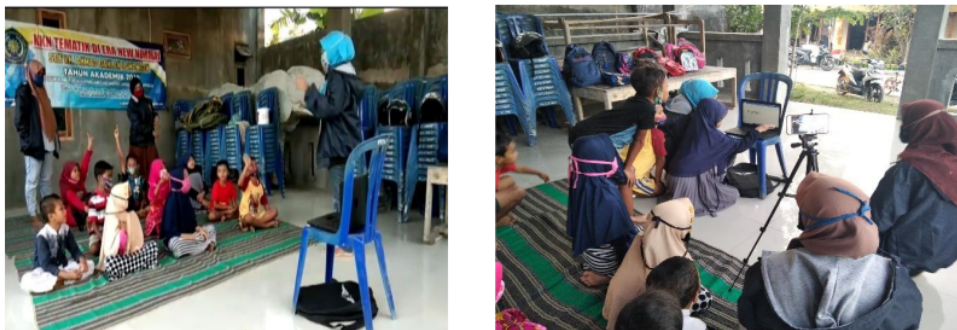
Gambar 3. Tahap Pembelajaran dan Pelatihan