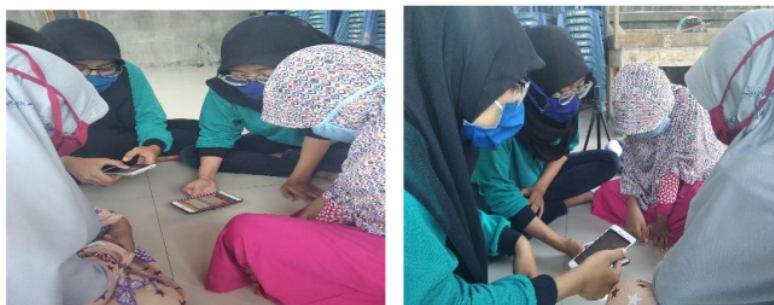
Gambar 4. Tahap Pendampingan Proses Pembelajaran melalui media Hand Phone

Pada tahap ini tugas dari pelaksana adalah mendampingi dan membimbing peserta agar mereka lebih memahami tata cara penggunaan aplikasi digital serta mengevaluasi sejauh mana pemahaman mereka setelah mendapat edukasi mengenai pemanfaatan aplikasi digital dalam pembelajaran interaktif ini.