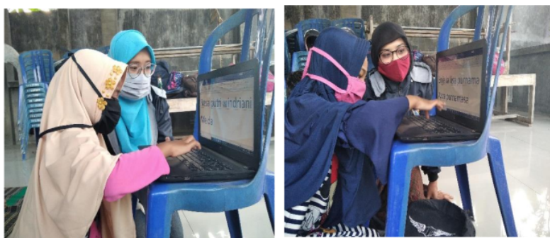
Gambar 5. Tahap Pendampingan Proses Pembelajaran Melalui Media Laptop